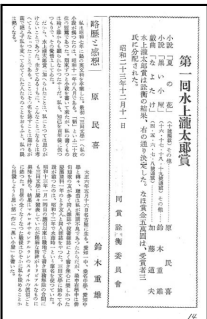
水上瀧太郎賞受賞

本多秋五の〈僕たちは一読して傑作と認め、雑誌にのせられたいのをいつまでも残念がつた〉という証言に現れている通り (5) 、「夏の花」（原題「原子爆弾」）は「三田文学」に掲載される前から原稿を読んだ人々の間で高い評価を得ており、一九四八年一月には「第一回水上瀧太郎賞」を受賞している。その際、原民喜はこれ