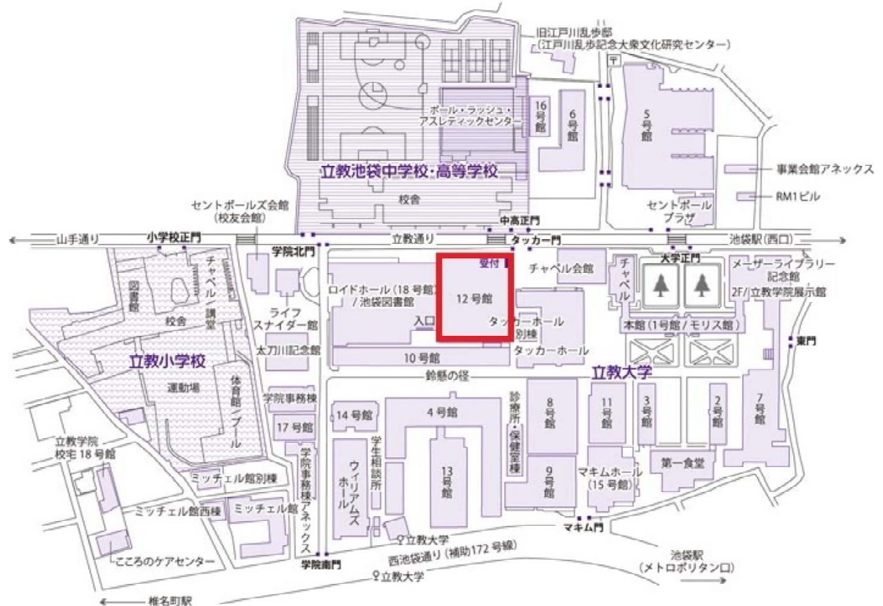
立教大学池袋キャンパス キャンパスマップ