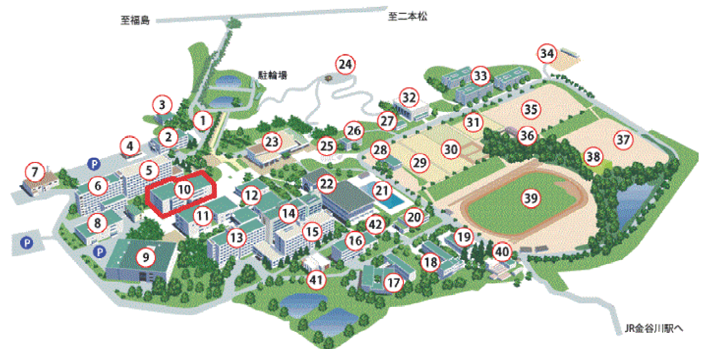
《福島大学地図 ※会場(S-24教室)は10番の建物の2階にあります》